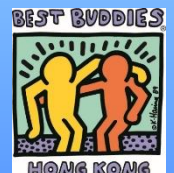
「弱智人士權益不容踐踏」記者招待會