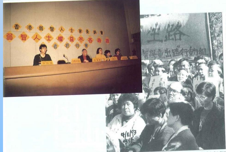
在討論康復政策的城市論壇上，一批弱智人士及其家長亦出席旁聽。